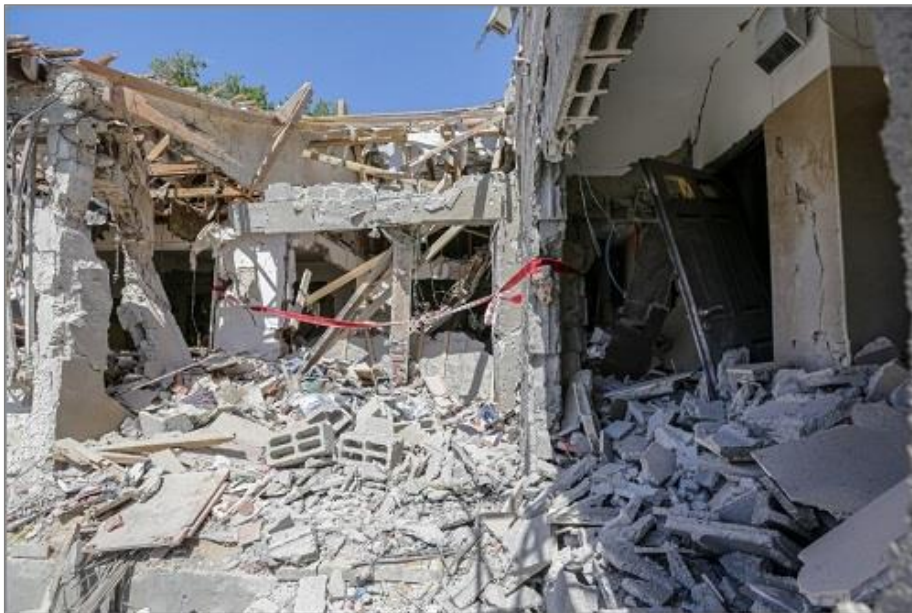
איור 3 - פגיעת הדף בקירות במבנה שלוד (קונבנציונלי)

מכאן, ניתן להסיק שבניית קירות חיצוניים מבטון, בדומה לקירות הנבנים בטכנולוגיית GSB תיתן מענה טוב משמעותית כנגד רסיסים חיצוניים הפוגעים בקיר וזאת לאור יתרונות הבטון בהתמודדות עם עצירת רסיסים.