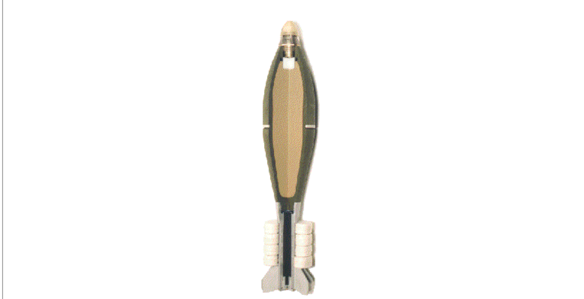
איור 6 – חתך טיפוסי של פצמ"ר

החישוב המוצג במסמך זה מתבסס על נוהל חישוב מתוך UFC-3-340-02 ומיועד לחישוב של פיצוץ מגע או פיצוץ קרוב מאוד על גבי קירות בטון מזויין וקביעת העובי של הקיר.