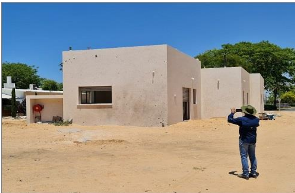
איור 5 - פגיעת רסס בקירות הבנויים GSB (כולל שכבת בידוד 6.5 ס"מ)