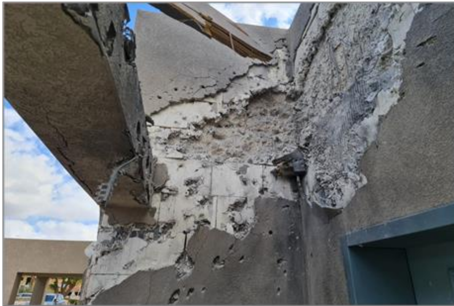
איור מספר 8 - פגיעה ישירה בקיר בטון הבנוי בטכנולוגיית GSB