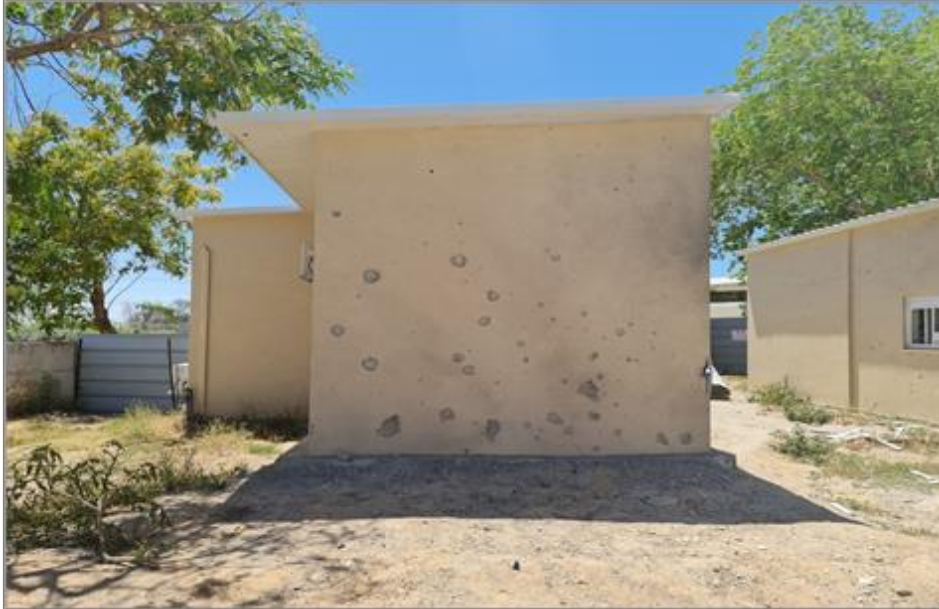
איור 4 - פגיעת רסס בקירות הבנויים בטון ללא שכבת בידוד (קונבנציונלי)