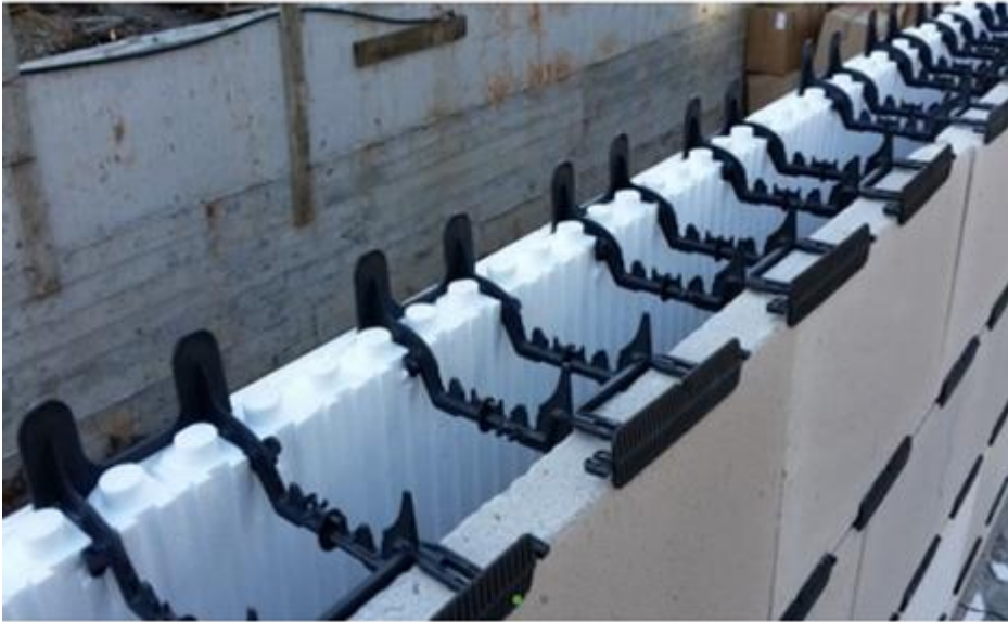
איור 2 – תבנית מורכבת לפני יציקה